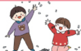
新聞ビリビリ遊び

児童発達支援クラスでは活動や自由遊びの中で、粘土やスライム、新聞ビリビリなど、感触遊びをよくしています。感触遊びは、ただ感触を楽しむだけではなく色々な力が身についていきます。みんな感触遊びが大好きで、1時間以上取り組むお友だちもいます。ただ触っているだけのように見えますが、楽しみながら色々な力が身についていくので、これからも感触遊びをたくさん取り入れていきたいと思います。